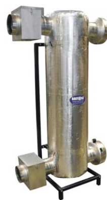
VENA SILVER 3.0